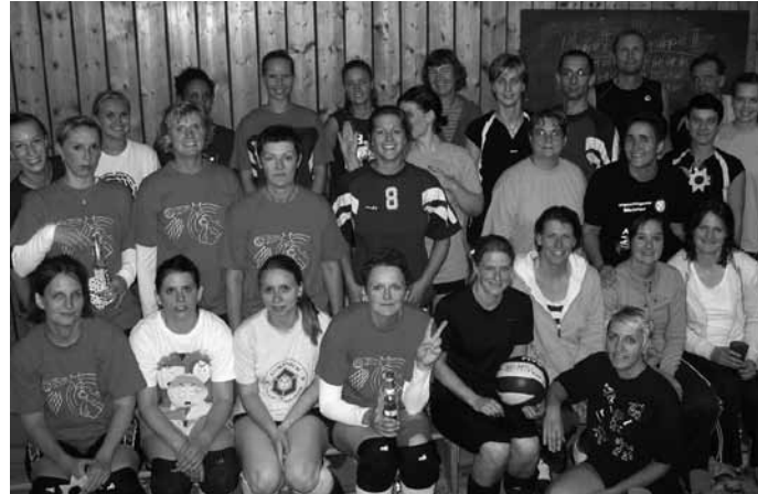
Die Teilnehmer des Schleifchenturniers.

Wer Lust hat, sich über die Volleyballabteilung zu informieren, kann dieses über unsere Homepage www.svsued-volleyball.de tun, welche wir mit dem Beitritt von der MTV-Seite verlinken lassen und umbenennen werden. Wir hoffen, dass die MTV-Volleyballer diese Seite mit ihren Gruppen und Mannschaften ergänzen. Dann wäre der erste Schritt des Zusammenwachsens getan.